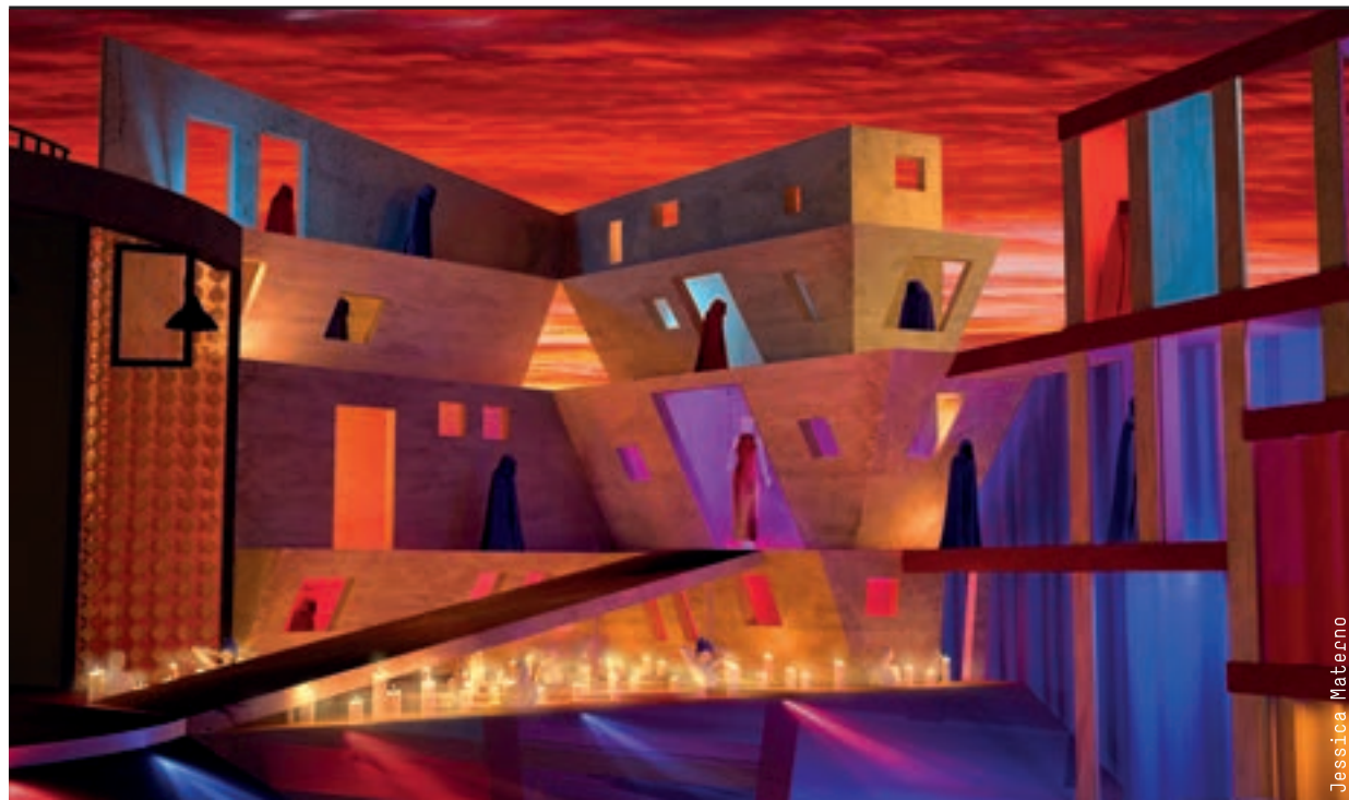
Work: Jessica Materano