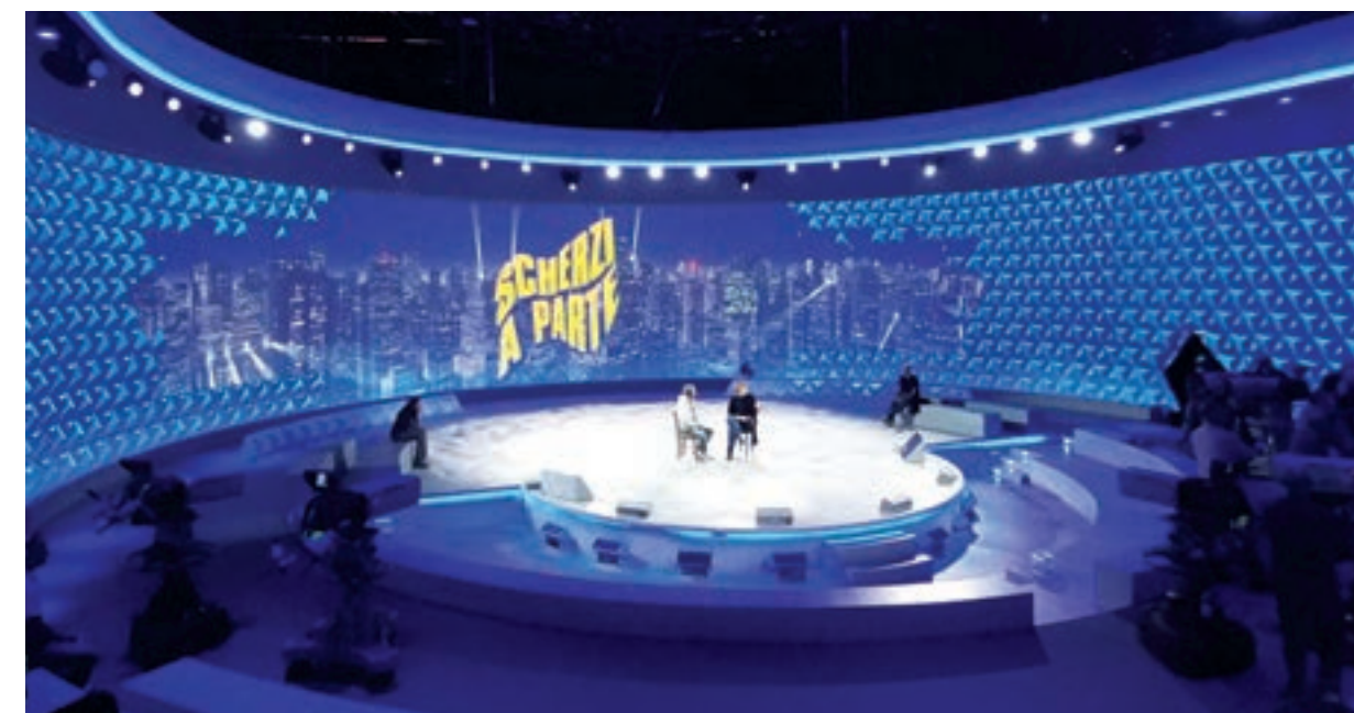
Work: Maria Chiara Castellini - Assistente: Manuel Bellucci

Set Design graduates will be capable of working as set design entrepreneurs, as art and creative directors and in the creative industry: in theater, cinema and television, Exhibit and Interior design, creating costumes and setting up spaces for any type of art and music event.