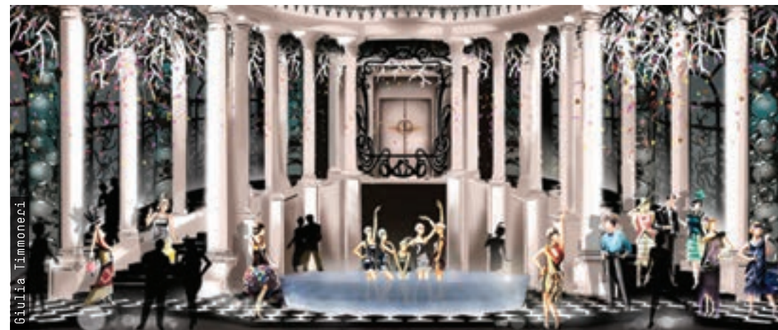
Work: Giulia Timoneri

During the entire course classes are supported by a series of collaborations and internships with the most important national and international set design companies. This Master of Arts is the natural continuation of the Bachelor of Arts in Set Design. Nevertheless, it may also be attended by students who come from different educational backgrounds and who wish to complete their studies by acquiring specific professional skills in this sector.